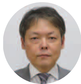
船本業務執行理事