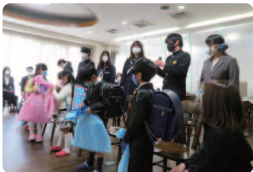
盛装して「お祝い会」に出席した子ども達

令和3年3月20日に前年同様法人内のご利用者・職員がお祝いに集って頂く行事は控え、子供の家の食堂で、理事長と各施設の施設長が代表して皆さんからの祝意を伝える形での開催となりました。