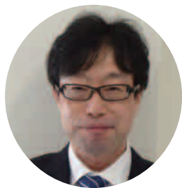
矢次業務執行理事